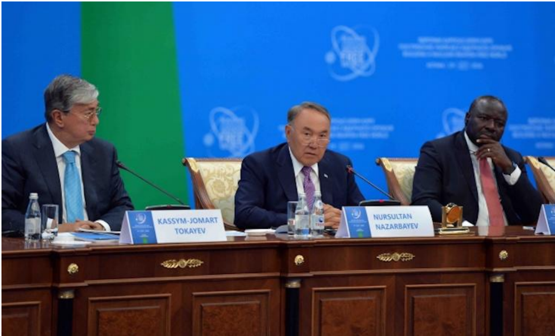
(left to right) Chairman of the Senate of the Parliament of Kazakhstan, Kassym-Jomart Tokayev; President Nazarbayev; Executive Secretary of the Preparatory Commission of the Comprehensive Nuclear Test-Ban Treaty Organization (CTBTO), Lassina Zerbo.