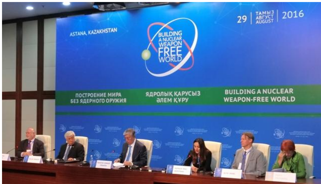
Closing Session of the International Conference “Building a Nuclear Weapon Free World” held in Astana, Kazakhstan on August 29, 2016.

本次会议的参加人员支持在宣言中表明的“实现无核武器世界应该是人类在 21 世纪的主要目标，而这一目标的实现应不迟于 2045 年，也就是联合国诞辰 100 周年之时”，这一期愿。