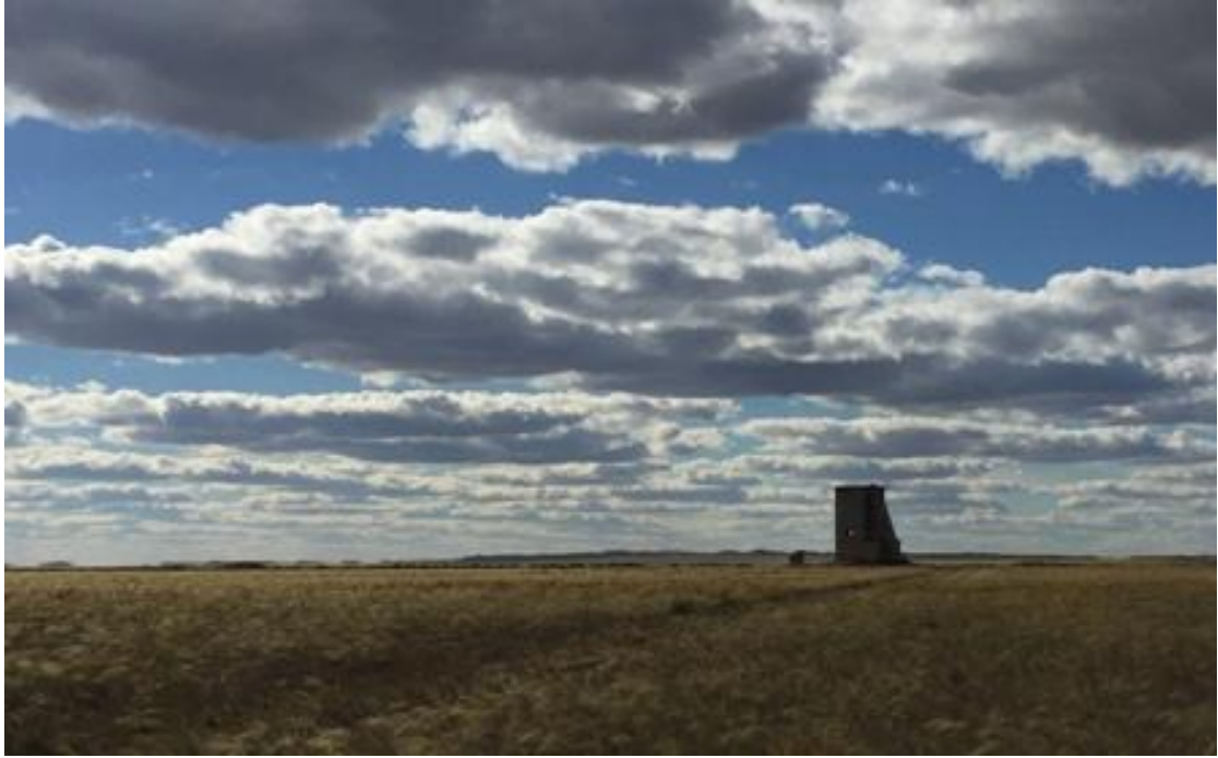
Former Nuclear Weapon Test Site of Semipalatinsk

金斯克核试验基地（Semipalatinsk Test Site）的法令而斩断了《戈耳迪之结（Gordian knot）》（核武器依赖这个难题）的国家。当我们采纳了这一决定之后，虽然几乎主要的核拥有国的核试验基地都无法使用了，但是这些试验基地却都没有关闭。哈萨克斯坦成为了第一个决定将核试验基地关闭的国家。这是通过我们人民的意志所实现的。而此事件对整个地球起到了重大的意义。”