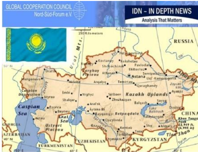
資料: Map of Kazakhstan

联合国秘书长潘基文说到:“通过哈萨克斯坦举办的此次会议‘再一次’展示了其致力于追求一个无核武器世界的意志”。