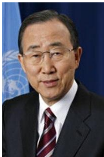
Ban Ki-moon

8月29日的国际会议，是由哈萨克斯坦参议院，该国的外交部，核裁军与核不扩散议员联盟（PNND）共同主办，在首都阿斯塔纳“独立宫”举行的。