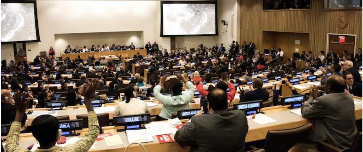
Moment of UN nuclear ban treaty adoption 7th July 2017.