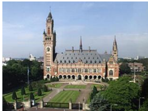
International Court of Justice

しかし、700以上の市民団体の連合が行動を起こし、NAM に対して、核保有国からの圧力に抵抗し、1994年の国連総会に決議案を再提出するよう動かしたのである。結果は、国連総会での採択へとつながり、さらに国際司法裁判所が、核兵器の使用とその威嚇の一般的違法性と、核軍縮達成の普遍的義務の存在を確認するという、歴史的判断が下されることになった。