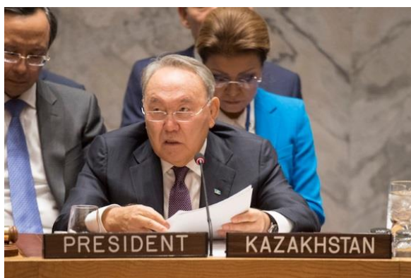
Nursultan Nazarbayev, President of Kazakhstan

その証左になるのが、冷戦終結時に橋渡し役としてきわめて影響力があり成功を収めた国であるカザフスタンが最近出した2つの提案に対して、核保有国がとった態度である。カ