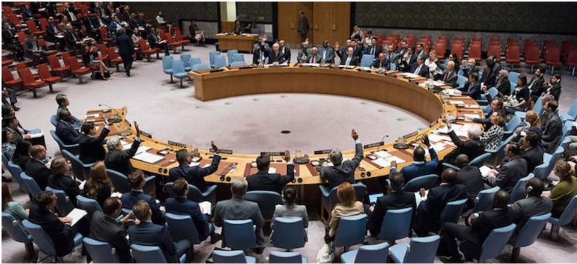
Security Council meeting on Maintenance of international peace and security, Nuclear non-proliferation and nuclear disarmament.