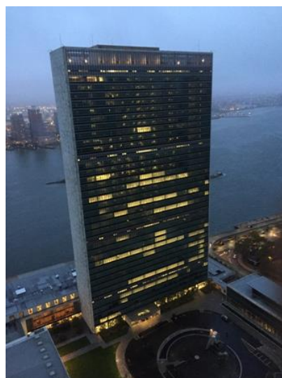
UN Secretariat Building

ザフスタンは1991年、ロシアと米国を協力させて、核の脅威を削減させ、カザフスタン・ウクライナ・ベラルーシの核兵器を解体させ、これらの国々の核物質の安全を確保するうえで大きな役割を果たした。