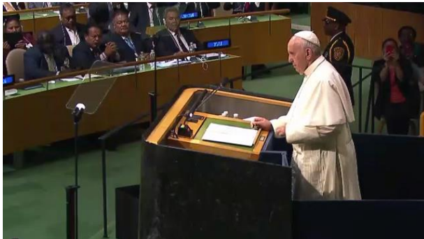
Pope Francis addressing the General Assembly at the United Nations headquarters in New York, USA

CTBT 의관련조항에더붙여서 「제 14 조회의」 라고도일컬어지는이회의에서는최종선 언이체택되어 「보편적이고 효과적인 검증이 가능한 조약은 국제적인 핵군축 및 핵불확산 체제의 중요한핵을 달성하는 요소다」 라는것이확인되었다.