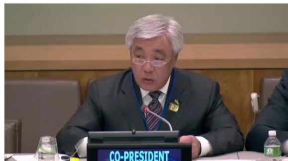
Erlan IDRISOV 資料 : CTBTO