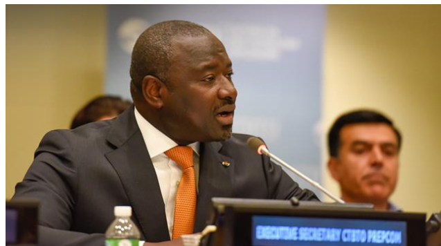
CTBTO Executive Secretary Lassina Zerbo at the ninth Article XIV conference in New York, USA

그 8 개국은 중국,에집트,인도,이란,이스라엘,파키스탄,미국,조선민주주의인민공화국이다.이들은 1990 년대의 조약의 최종교섭시기에 있어서 핵기술을갖고있는 44 개국이 리스트에 포함되는 나라들이다.