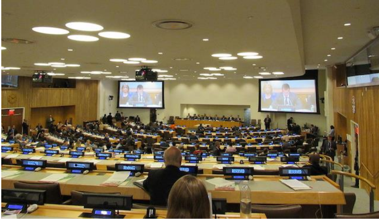
A view of the ministerial meeting at the UN headquarters