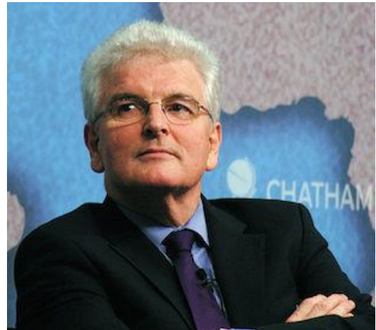
Des Browne