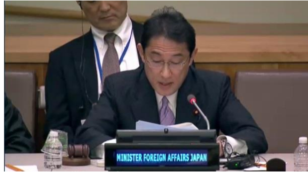
Fumio Kishida

원폭투하로부터 70 년이라는시기에 핵폭탄의 생존자(피폭자)의 경험을 언급하였다.