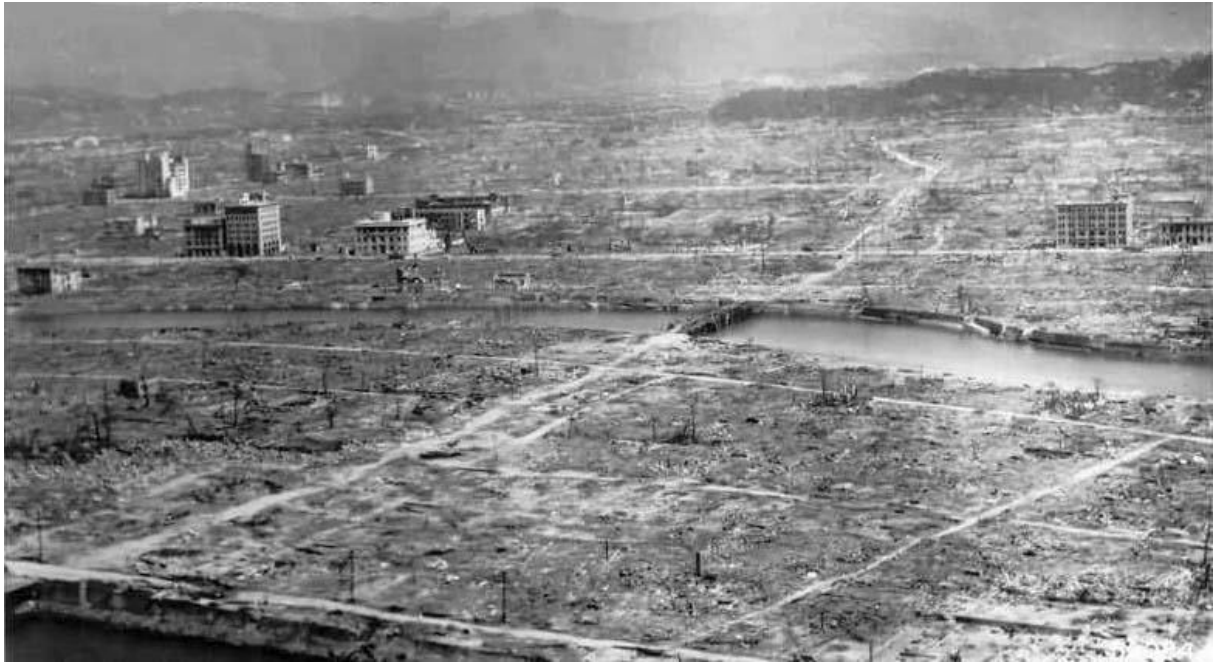
Hiroshima aftermath

역사가얕은나라로써우리나라는모든나라들이군축을위한좋은자극이되기를바라고있습니다.