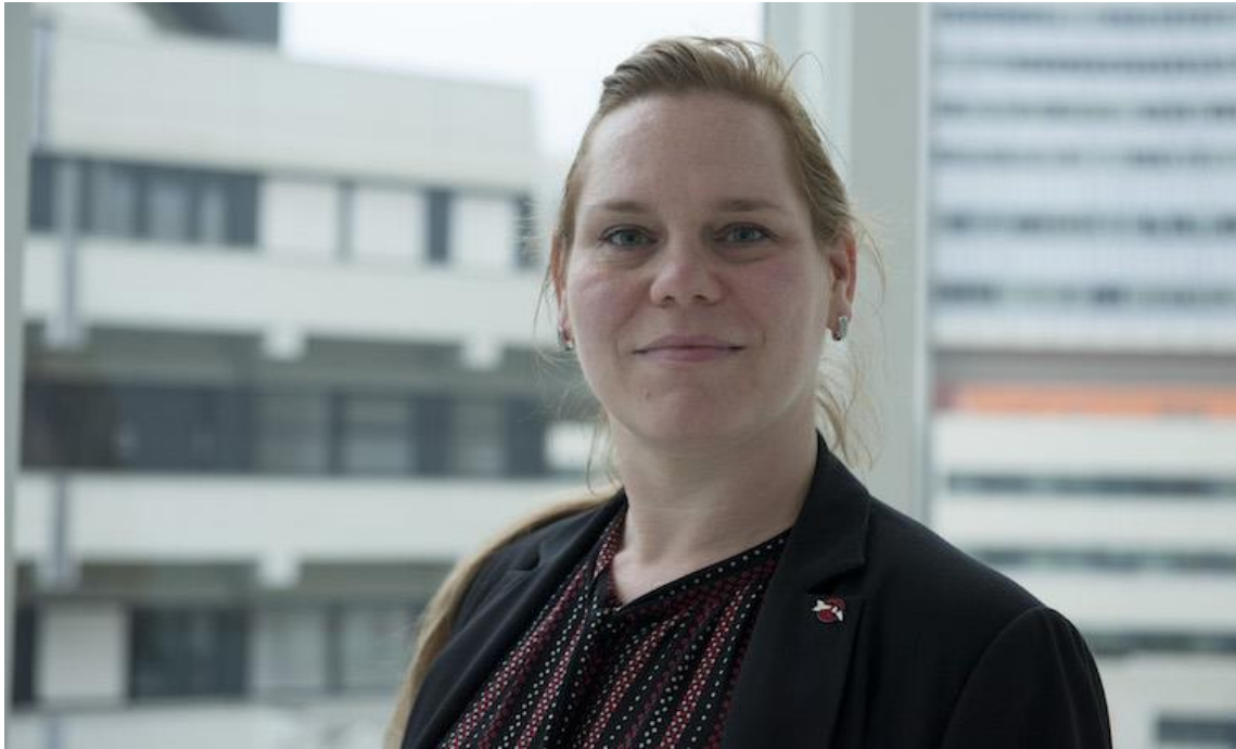
資料 : Susi Snyder