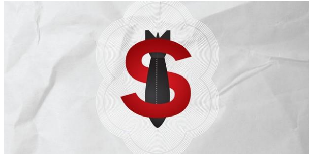
資料 : ICAN

할수있게 될것이다. 더우기,이러한 실천 예로는 체결국 회의에서 공유를할수가 있는것이 가능하고, 만약 각국이 그것을 채택하게 된다면 이행조치에 관한 지원을 요청한다든가 제공을 하는것등이 가능할것이다.