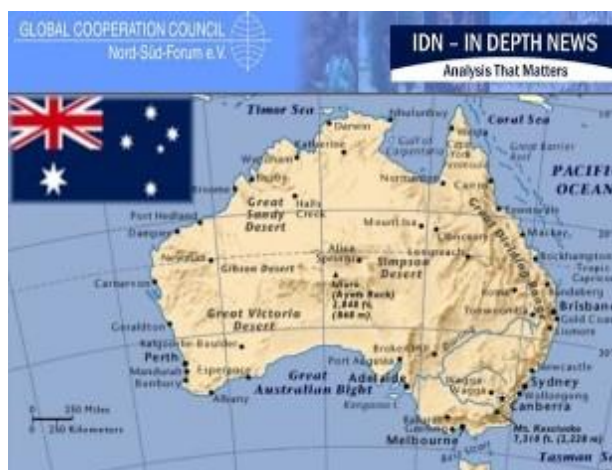
資料：Map of Australia

をもってこなかった。オーストラリアが米国のアジアにおける抑止力を支えるために政治面とともに戦略面で何ができるかという問題が、過去にもまして将来的に重要になってくるであろう。」