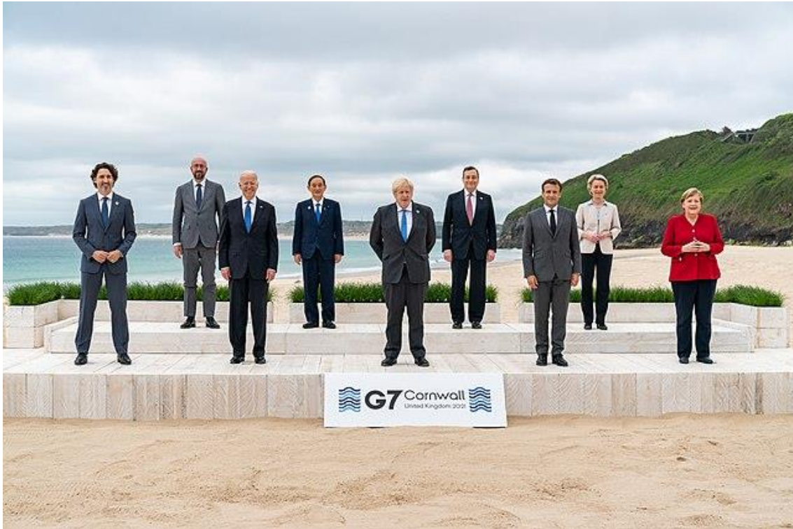
President Joe Biden takes a G7 leaders family photo on Friday, June 11, 2021, at the Carbis Bay Hotel and Estate in St. Ives, Cornwall, England.