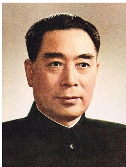
Portrait of Chinese Premier Zhou Enlai (1898-1976)

インドの元外相で元駐中国大使のビジェイ・ゴカール氏は別の見解を持っているようだ。著名な『ヒンドゥー』紙への2020年3月20日付の寄稿で同氏は、中国は中国外交の「マントラ（自説）」を放棄したと指摘したうえで、「かつて中国の外交官は言葉を選び尊厳を保っていた。力を誇示することがあっても、声高になることはなかった。交渉の要諦は相手方よりも多くのことを知ることにあるというのが周恩来首相の教えであり、かつての中国外交官は説明の天才であった。」と論じた。